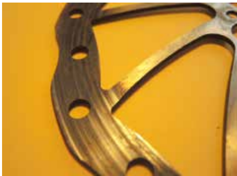
Ce disque usé doit être remplacé

En fait, c'est maintenant que sa bécane est particulièrement mise à contribution ... lors de la descente! Car les freins vont chauffer sous l'effet du frottement des gommages sur les jantes ou des plaquettes sur les disques. Pour éviter les pépins, on ne le redira jamais assez: «Un vélo bien entretenu est gage de sécurité!»